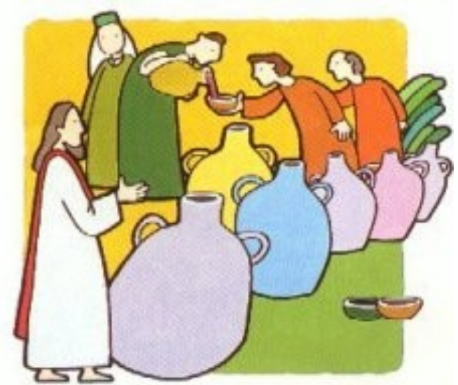
예수님께서는 처음으로 갈릴래아 카나에서 표징을 일으키셨다. <요한 2,1-11>