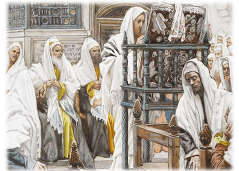
오늘 이 성경 말씀이 이루어졌다. < 루카 1,1-4; 4,14-21 >

성 가 입당: 21 봉헌: 216 성체: 155/161 파견: 415 제 1 독서 느헤미야기 8,2-4.5-6.8-10 <레위인들은 율법서를 설명하면서 읽어 주었다.> 화 답 송 ◎주님, 당신 말씀은 영이며 생명이시옵니다. 제 2 독서 코린토 1서 12,12-30 <여러분은 그리스도의 몸이고 한 사람 한 사람이 그 지체입니다.> 복음환호송 ◎ 알렐루야. ○ 주님이 나를 보내시어 가난한 이들에게 기쁜 소식을 전하고 잡혀간 이들에게 해방을 선포하게 하셨다. ◎ 알렐루야. 복 음 루카 1,1-4; 4,14-21 <오늘 이 성경 말씀이 이루어졌다.> 영 성 체 송 주님께 나아 가면 빛을 받으리라. 너희 얼굴에는 부끄러움이 없으리라.