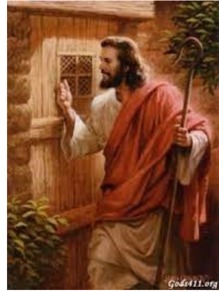
너희도 준비하고 있어라 < 루카 12, 35-40 >

성 가 입당: 66 봉헌: 218 성체: 156/162 파견: 78 제 1 독서 민수기 6, 22-27 <이스라엘 자손들 위로 나의 이름을 부르며, 내가 그들에게 복을 내리겠다.> 화 답 송 ◎주 하느님의 어지심을 저희 위에 내리소서. 제 2 독서 야고보서 4, 13-15 <여러분은 내일 일을 알지 못합니다. 여러분의 생명이 무엇입니까?> 복음환호송 ◎ 알렐루야. ○ 나날이 당신을 찬미하고 영영 세세 당신 이름을 찬양하나이다. ◎ 알렐루야. 복 음 루카 12, 35-40 <너희도 준비하고 있어라.> 영 성 체 송 예수 그리스도는 어제도 오늘도 또 영원히 같은 분이시다.