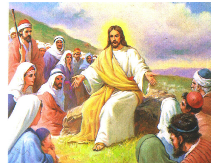
너희 아버지께서 자비하신 것처럼 너희도 자비로운 사람이 되어라. < 루카 6,27-38 >

성가 제1독서: 입당: 46 봉헌: 221 성체: 170/507 파견: 45 사무엘기 상권 26,2.7-9.12-13.22-23 <주님께서 임금님을 제 손에 넘겨 주셨지만, 저는 손을 대려 하지 않았습니다.> 화답송 제2독서: ◎ 주님은 자비롭고 너그러우시네. 코린토 1서 15,45-49 <우리가 흠으로 된 그 사람의 모습을 지녔듯이 하늘에 속한 그분의 모습도 지니게 될 것입니다.> 복음환호송: ◎ 알렐루야. ◎ 주님이 말씀하신다. 내가 너희에게 새 계명을 준다. 서로 사랑하여라. 내가 너희를 사랑한 것처럼 너희도 서로 사랑하여라. ◎ 알렐루야. 복음: 루카 6,27-38 <너희 아버지께서 자비하신 것처럼 너희도 자비로운 사람이 되어라.> 영성체송: 주님의 기적들을 날날이 전하오리다. 지극히 높으신 분, 저는 당신 안에서 기뻐하고 즐거워하며, 당신 이름 찬미하나이다.