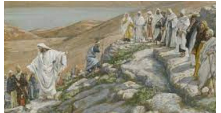
마음에서 넘치는 것을 입으로 말하는 법이다. < 루카 6,39-45 >

성 가 입당: 13 봉헌: 216 성체: 179/497 파견: 12 제 1 독서 집회서 27,4-7 <말을 듣기 전에는 사람을 칭찬하지 마라.> 화 답 송 ◎ 주님, 당신을 찬미하오니 좋기도 하옵니다. 제 2 독서 코린토 1서 15,54-58 <하느님께서서는 예수 그리스도를 통하여 우리에게 승리를 주십니다.> 복음환호송 ◎ 알렐루야. ○ 이 세상에서 별처럼 빛나도록 너희는 생명의 말씀을 굳게 지녀라. ◎ 알렐루야. 복 음 루카 6,39-45 <마음에서 넘치는 것을 입으로 말하는 법이다.> 영 성 체 송 은혜를 베푸신 주님께 노래하리이다. 지극히 높으신 주님 이름 찬양하리이다.