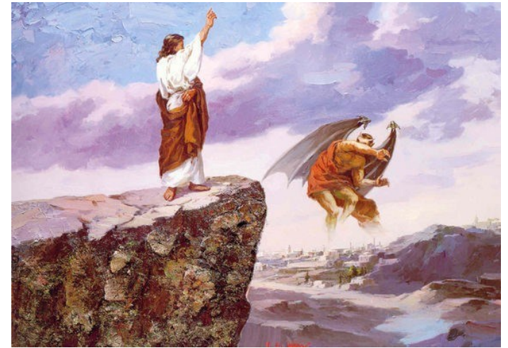
예수님께서서는 성령에 이끌려 광야로 가시어, 유혹을 받으셨다. < 루카 4,1-13 >