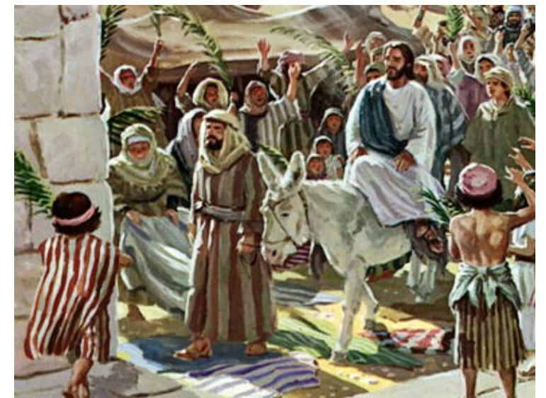
우리 주 예수 그리스도의 수난기 < 루카 22,14-23,56 >

성가 제 1 독서 입당: 10 봉헌: 220 성체: 190/187 파견: 123 이사야서 50,4-7 <나는 모욕을 받지 않으려고 내 얼굴을 가리지도 않았다. 나는 부끄러운 일을 당하지 않을 것임을 안다(주님의 종'의 셋째 노래).> 화답 송 제 2 독서 ◎ 하느님, 저의 하느님, 어찌하여 저를 버리셨나이까? 필리피서 2,6-11 <그리스도께서는 당신 자신을 낮추셨습니다. 그러므로 하느님께서도 그분을 드높이 올리셨습니다.> 복음환호송 ◎ 그리스도님, 찬미와 영광 받으소서. ○ 그리스도는 우리를 위하여 죽음에 이르기까지, 십자가 죽음에 이르기까지 순종하셨네. 하느님은 그분을 드높이 올리시고 모든 이름 위에 뛰어난 이름을 주셨네. ◎ 그리스도님, 찬미와 영광 받으소서. 복음 성체 송 루카 22,14-23,56 <우리 주 예수 그리스도의 수난기> 아버지, 이 잔을 비켜 갈 수 없어 제가 마셔야 한다면, 아버지의 뜻이 이루어지게 하소서.