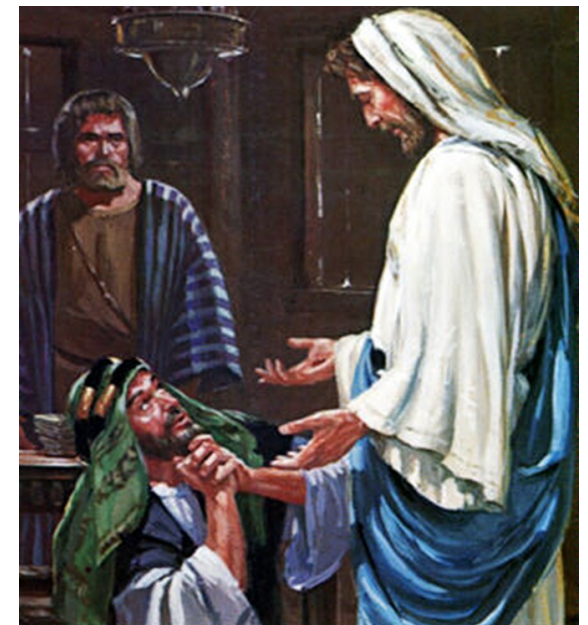
여드레 뒤에 예수님께서 오셨다. < 요한 20,19-31 >

성 가 입당: 129 봉헌: 210 성체: 158/162 파견: 130 제 1 독서 사도행전 5,12-16 <주님을 믿는 남녀 신자들의 무리가 더욱더 늘 어났다.> 화 답 송 ◎ 주님은 좋으신 분, 찬송하여라. 주님의 자애는 영원하시다. 제 2 독서 요한 묵시록 1,9-11.12-13.17-19 <나는 죽었지만, 보라, 영원 무궁토록 살아 있다.> 복음환호송 ◎ 알렐루야. ○ 주님이 말씀하신다. 토마스야, 너는 나를 보고서야 믿느냐? 보 지 않고도 믿는 사람은 행복하다. ◎ 알렐루야. 복 음 요한 20,19-31 <여드레 뒤에 예수님께서 오셨다.> 영 성 체 송 네 손을 넣어 못 자국을 확인해 보아라. 의심을 버리고 믿어라. 알 렐루야.