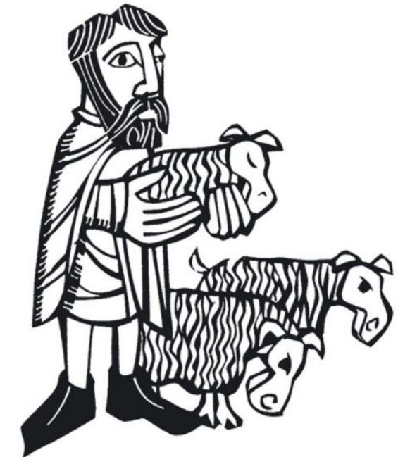
나는 내 양들에게 영원한 생명을 준다. < 요한 10,27-30 >

성 가 입당: 139 봉헌: 214 성체: 168/172 파견: 130 제 1 독 서 사도행전 13,14.43-52 <이제 우리는 다른 민족들에게 돌아섭니다.> 화 답 송 ◎ 우리는 주님의 백성, 그분 목장의 양떼라네. 제 2 독 서 요한 묵시록 7,9.14-17 <어린양이 그들을 돌보시고 생명의 샘으 로 그들을 이끌어 주실 것이다.> 복음환호송 ◎ 알렐루야. ○ 주님이 말씀하신다. 나는 착한 목자다. 나는 내 양들을 알고 내 양들은 나를 안다. ◎ 알렐루야. 복 음 요한 10,27-30 <나는 내 양들에게 영원한 생명을 준다.> 영 성 체 송 착한 목자, 당신 양들을 위하여 목숨을 바치셨네. 당신 양 떼를 위 하여 돌아가시고 부활하셨네. 알렐루야.