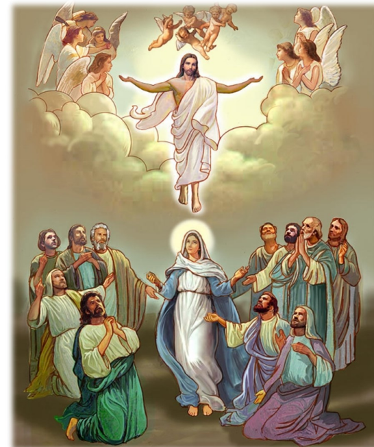
예수님께서는 그들에게 강복하시며 하늘로 올라가셨다. < 루카 24,46-53 >