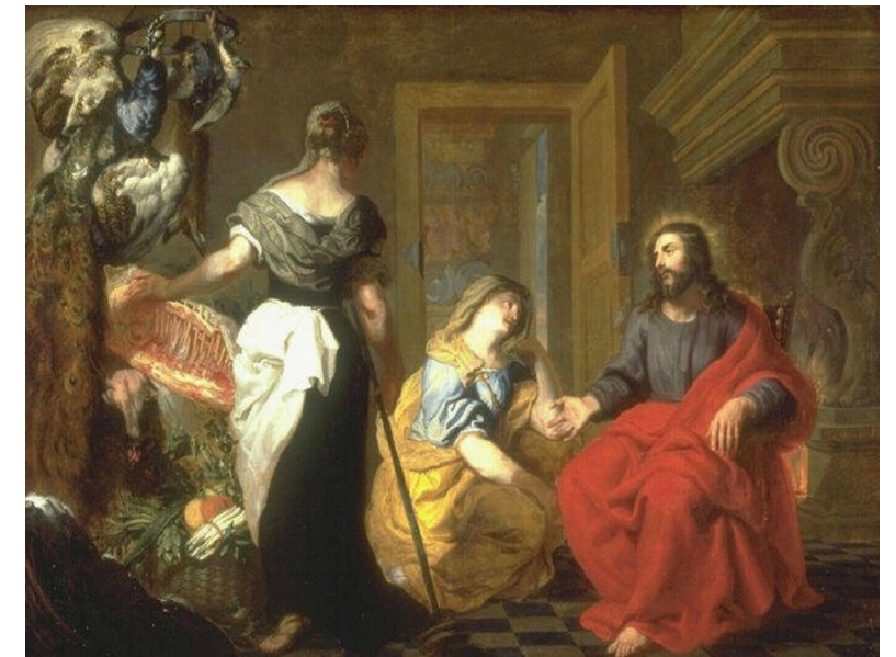
마르타는 예수님을 자기 집으로 모셔 들였다. 마리아는 좋은 몫을 선택하였다. < 루카 10,38-42 >

성가 입당: 59 봉헌: 211/513 성체: 151/157 파견: 32 제1독서 창세기 18,1-10 <나리, 부디 이 종을 그냥 지나치지 마십시오.> 화답송 ◎ 주님, 당신의 천막에 누가 머물리이까? 제2독서 콜로새서 1,24-28 <과거의 모든 시대에 감추어져 있던 신비가 이제 성도들에게 명백히 드러났습니다.> 복음환호송 ◎ 알렐루야. ○ 바르고 착한 마음으로 하느님 말씀을 간직하여 인내로 열매를 맺는 사람들은 행복하여라! ◎ 알렐루야. 복음 루카 10,38-42 <마르타는 예수님을 자기 집으로 모셔 들였다. 마리아는 좋은 몫을 선택하였다.> 영성체송 당신 기적들 기억하게 하시니, 주님은 너그럽고 자비로우시다. 당신 경외하는 이들에게 양식을 주신다.