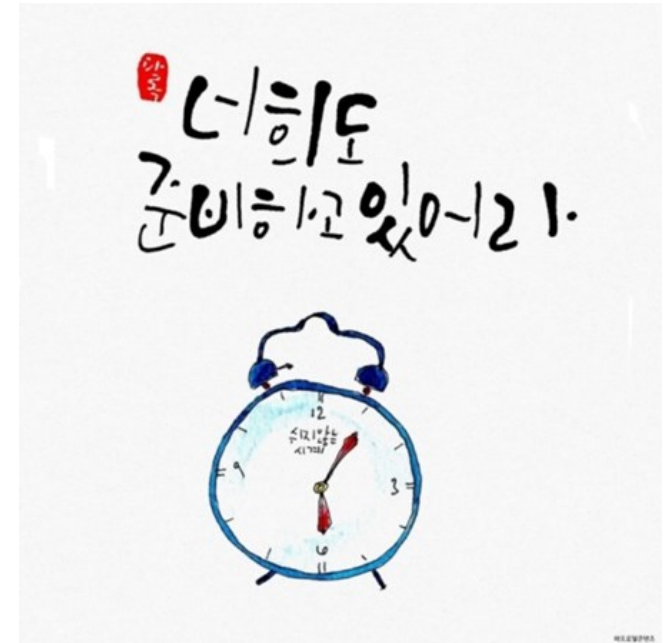
너희도 준비하고 있어라. < 루카 12, 32-48 >

성 가 입당: 4 봉헌: 212/214 성체: 499/187 파견: 64 제 1 독서 지혜서 18,6-9 <주님께서는 저희의 적들을 처벌하신 그 방법으로 저희를 당신께 부르시고 영광스럽게 해주셨습니다.> 화 답 송 ◎ 행복하여라, 주님이 당신 소유로 뽑으신 백성! 제 2 독서 히브리서 11,1-2.8-19 <아브라함은 하느님께서 설계하시고 건축하신 도성을 기다리고 있었습니다.> 복음환호송 ◎ 알렐루야. ○ 깨어 준비하고 있어라. 생각하지도 않은 때에 사람의 아들이 오리다. ◎ 알렐루야. 복 음 루카 12,32-48 <너희도 준비하고 있어라.> 영 성 체 송 예루살렘아, 주님을 찬미하여라. 주님은 기름진 밀로 너를 배 불리신다.