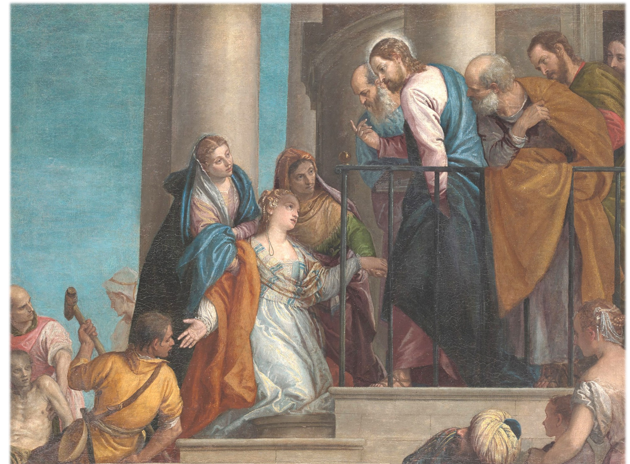
<하혈하는 여인을 고쳐시는 그리스도> Paolo Veronese, 1528-1588