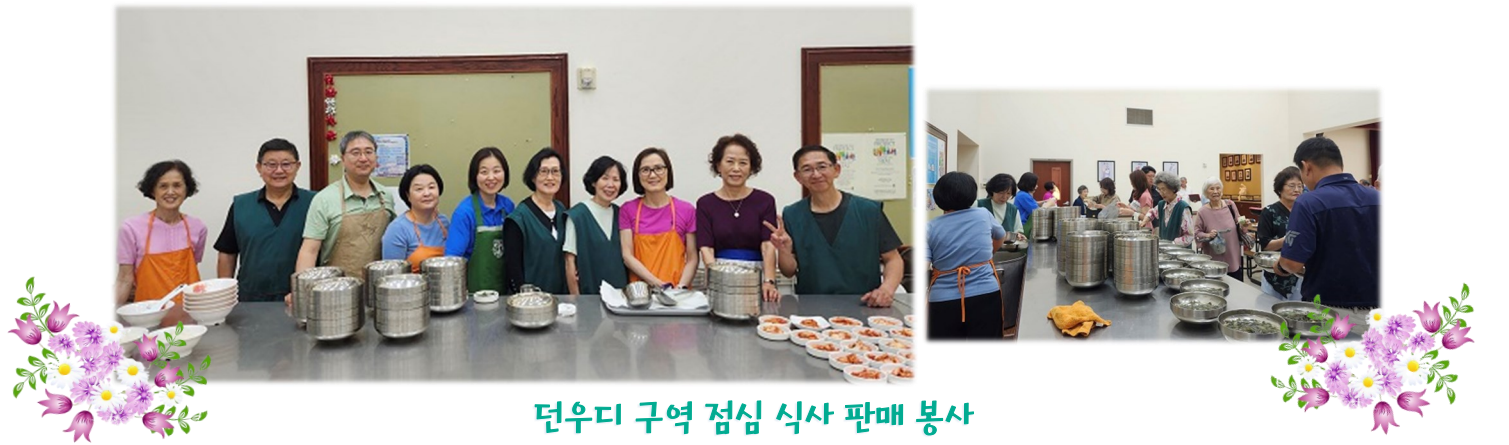
던우디 구역 점심 식사 판매 봉사