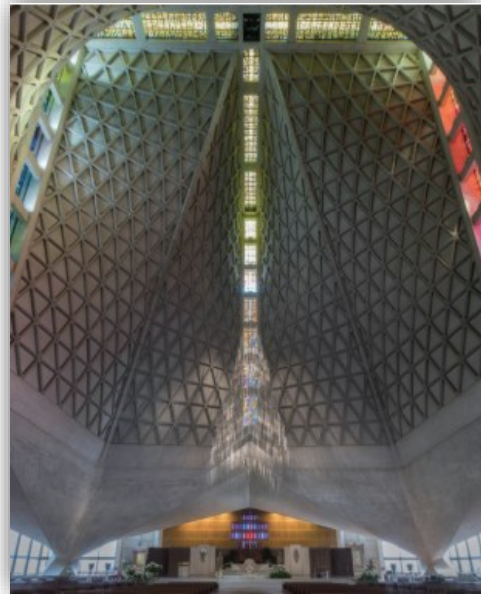
성모 승천 대성당, 피에르 루이지 네르비 설계, 1971년, 샌프란시스코

다. 견고한 벽과 아름다운 스테인드글라스가 넓게 트인 공간을 에워싸며 우리를 '안'으로 감싸고 있습니다. 이런 공간에서 우리는 '그리스도 안에서' 새 생명을 얻고 변화하는 내적인 힘을 더 깊이 느낍니다.