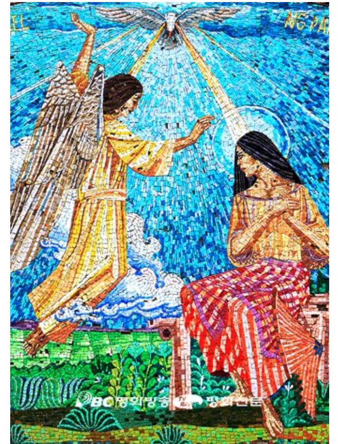
예수님의 고향 나자렛 사람들은 성경 말씀이 이뤄졌다는 예수님 말씀을 믿지 않았다. 동정 마리아는 천사의 전갈에 믿음으로 응답함으로써 예수 그리스도의 어머니가 되었다. 사진은 나자렛 주님탄생예고 대성당 모자이크화.

그때에 예수님께서 고향으로 가셨는데 제자들도 그분을 따라갔다. 안식일이 되자 예수님께서서는 회당에서 가르치기 시작하셨다. 많은 이가 듣고는 놀라서 이렇게 말하였다. “저 사람이 어디서 저 모든 것을 얻었을까? 저런 지혜를 어디서 받았을까? 그의 손에서 저런 기적들이 일어나다니! 저 사람은 목수로서 마리아의 아들이며, 야고보, 요세, 시몬과 형제간이 아닌가? 그러면서 그들은 그분을 못마땅하게 여겼다. 그러자 예수님께서 그들에게 이르셨다. “예언자는 어디에서나 존경받지만 고향과 친척과 집안에서만은 존경받지 못한다.” 그리하여 예수님께서서는 그곳에서 몇몇 병자에게 손을 얹어서 병을 고쳐 주시는 것밖에는 아무런 기적도 일으키실 수 없었다. 그리고 그들이 믿지 않는 것에 놀라셨다. 예수님께서서는 여러 마을을 두루 돌아다니며 가르치셨다.