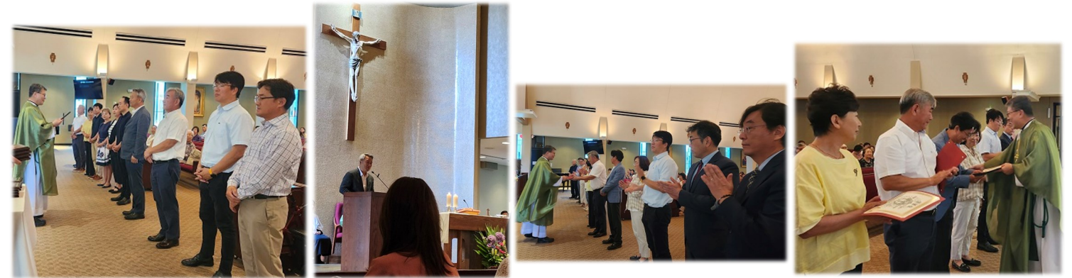
26회 사목위원 감사패 전달식 및 사목회장님의 이임사 & 27대 사목위원 및 재정위원회 임명장 수여 수고해주신 26회 사목위원님들께 감사드립니다. 27대 사목위원님들을 위해 많은 기도 부탁드립니다.