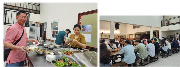
청년 미사 후 저녁 식사 봉사