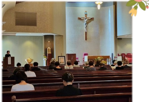
故한수정 마리아 1주기 연도