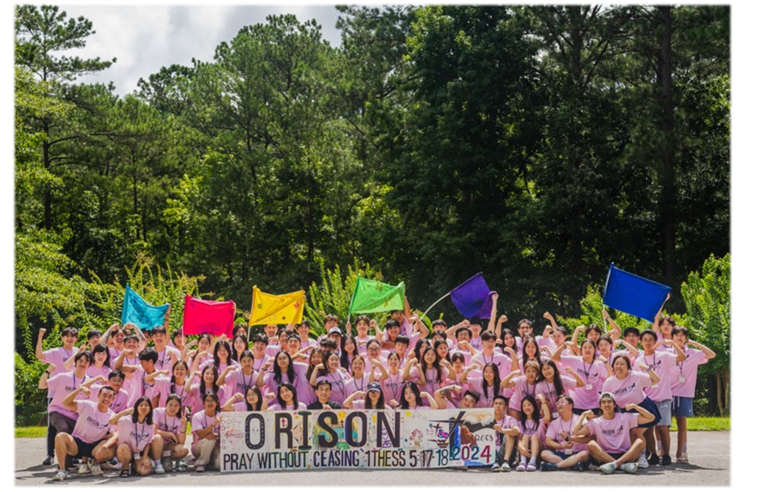
◀KMCC & SAKC Youth Group 여름캠프 단체사진▶