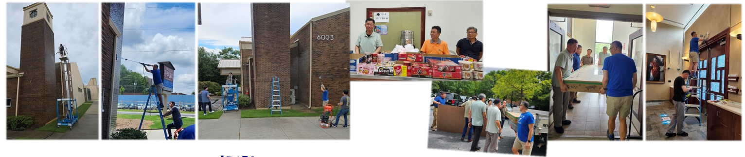
망치회 - 성당 보수 공사, 외벽 고압 물청소, 주일 미사후 김밥 판매

망치회 형제님들이 지난 주말 성당 내/외부를 깨끗하게 청소&수리해 주셨습니다. 항상 수고해주시는 망치회 봉사자분들을 위해 많은 기도과 관심 부탁드립니다.