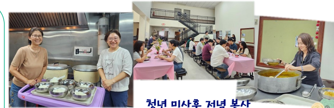
청년 미사후 저녁 봉사 수고해주시는 봉사자분들께 감사드립니다.