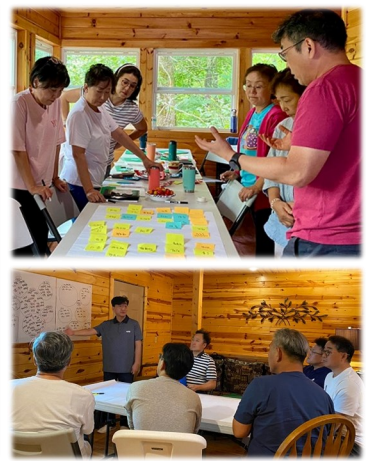
27대 사목회 워크숍 (7/19-7/21)