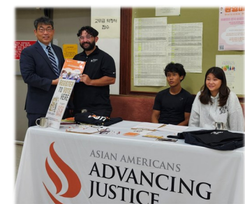
미시민권자 유권자 등록 및 투표 안내 행사