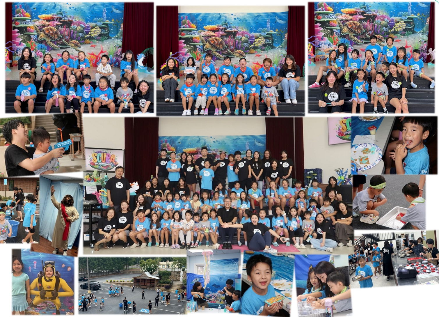
주일학교 SCUBA 여름 성경 학교 수고해주신 주일학교 선생님들과 학부모 봉사자분들께 감사드립니다.