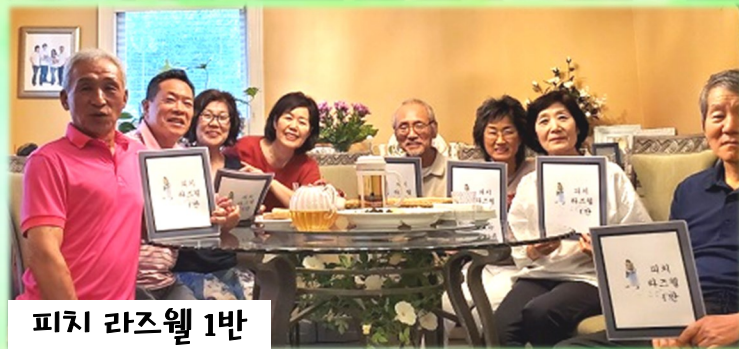
피치 라즈웰 1반