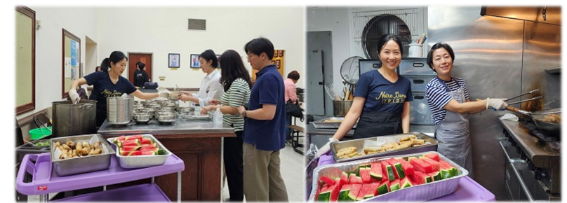
청년 미사후 저녁 봉사 수고해주신 봉사자분들께 감사드립니다.