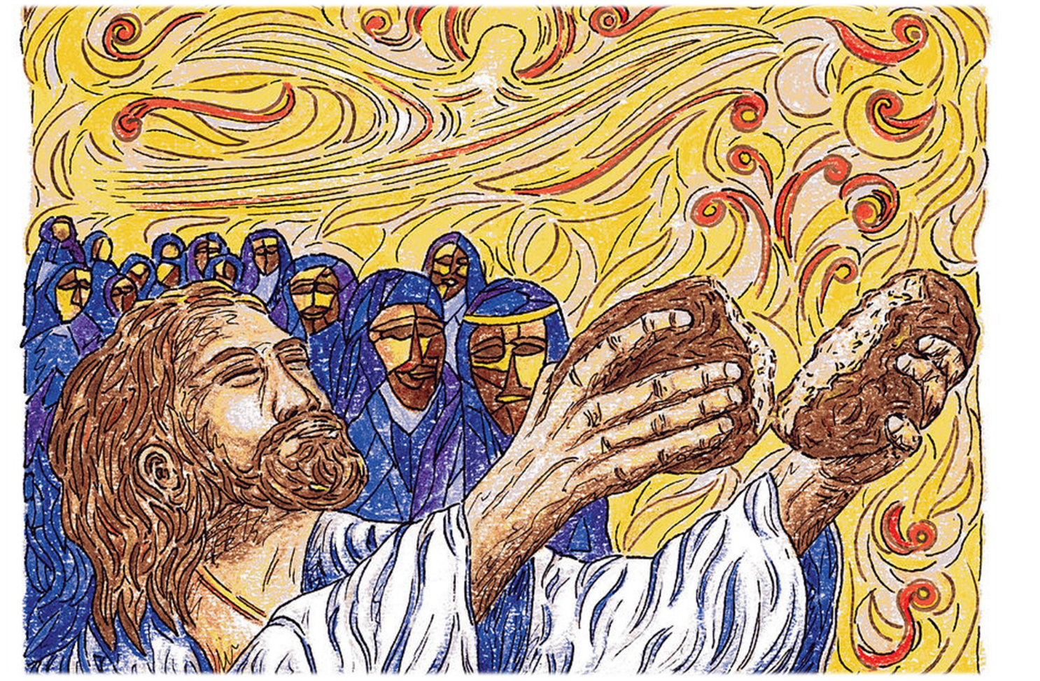
〈Jesus Breaking Bread for the Five Thousand by Brent Kastler〉