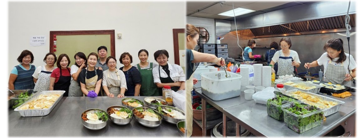
주일 미사 후 점심 판매