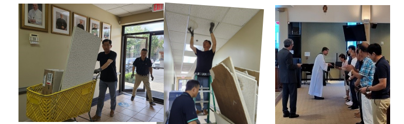
망치회 성당 보수 작업