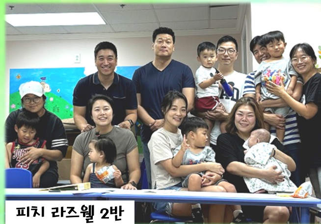
피치 라즈웰 2반