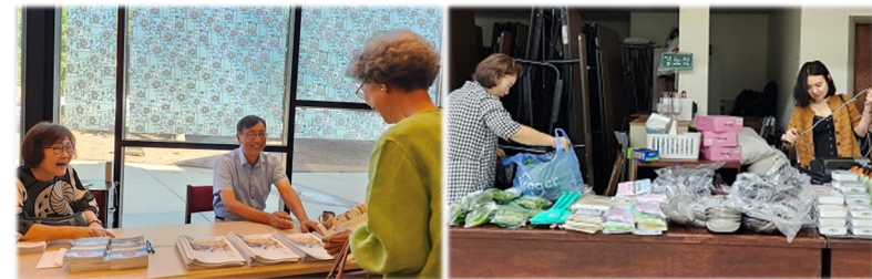
주보 및 매일미사 책 배부