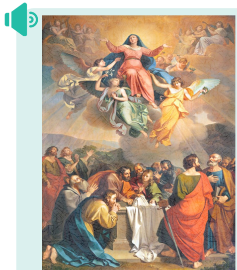
성모 승천 대축일