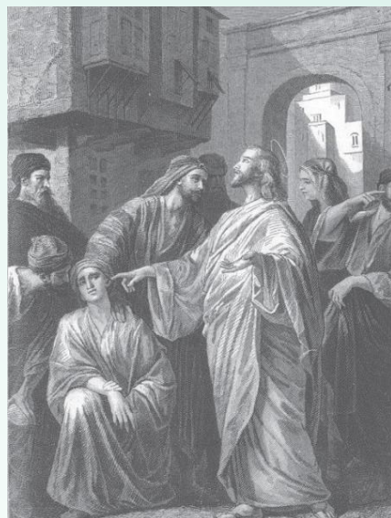
Alexandre Bida, 동판화, 그리스도의 생애 삽화

예수님께서 귀먹고 말 더듬는 여인을 건성으로 치유하지 않으셨다. 예수님께서 당신 손가락을 그녀의 두 귀에 놓으셨다가 침을 발라 그녀의 혀에 손을 대셨다. 그리고 나서 하늘을 우러러 한숨을 내쉬신 다음, 그녀에게 “에파타!” 곧 “열려라!” 하고 말씀하셨다. 그분은 그녀를 고치려고 귀를 후비고 침을 바르셨다. 그리고 하늘을 우러러 기도 하셨으며, 그가 낱기를 간절히 원하면서 “열려라!”하고 말씀하셨다. 그분은 당신의 사랑을 그녀에게 느끼게 해주셨다. 그래서 그녀는 들을 수 있었고 말할 수 있었다. 그녀는 귀가 열리고 묵인 혀가 풀려서 말을 제대로