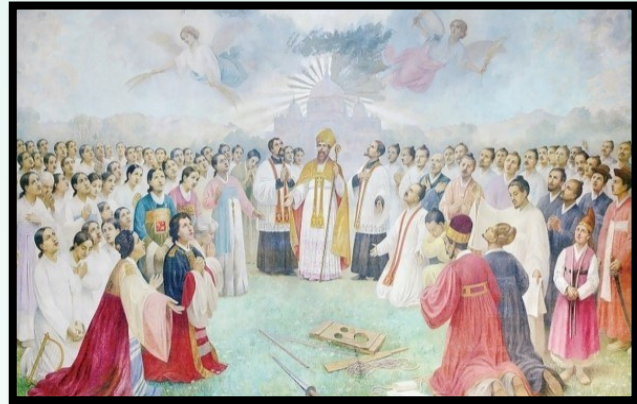
<79위 시복화> 주스타니안, 1925년

기해박해(1939) 순교자 70위와 병오박해(1846) 순교자 9위 총 79위가 1925년 시복되며 그려진 시복화입니다.