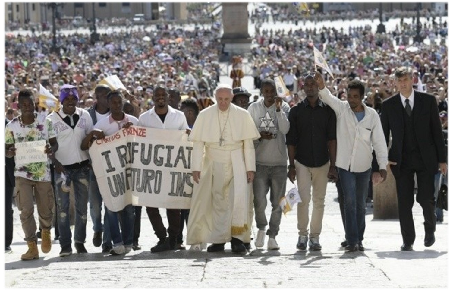
"God walks with His people" - the title chosen by Pope Francis for his Message for the World Day of Migrants and Refugees