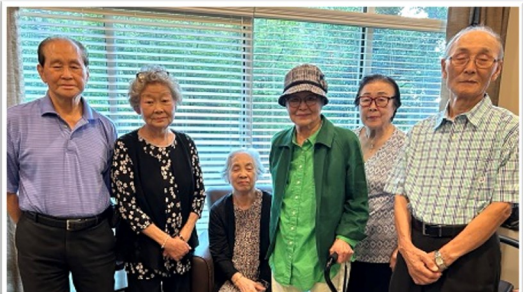
Heart Side 반