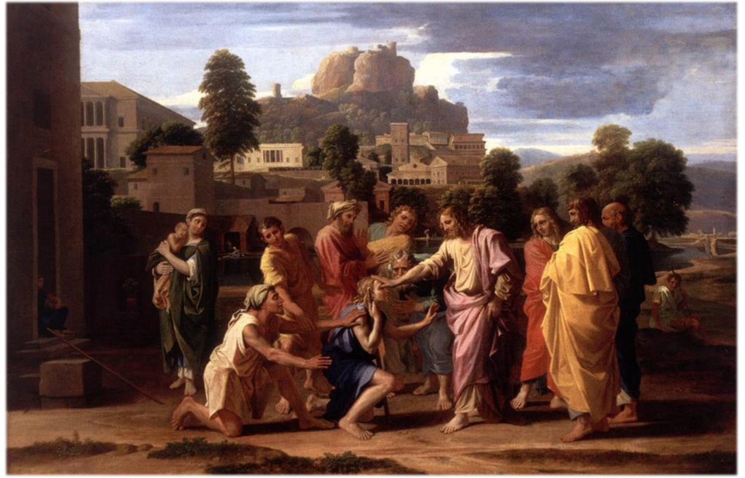
<눈 먼 이를 고치시는 예수님, 니콜라 푸생, 루브르 박물관, 파리 프랑스.>