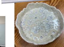
킨더/1학년 아트 개인 초대 만들기