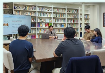
청년 예비자 교리반