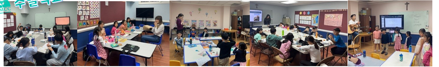
초등부 수업 & 킨더/1학년 음악수업