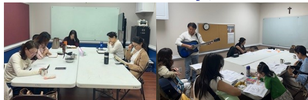
<모.하.기.> 성경읽기반 & 기타수업