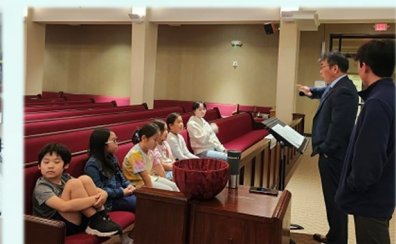
예비 복사단 교육