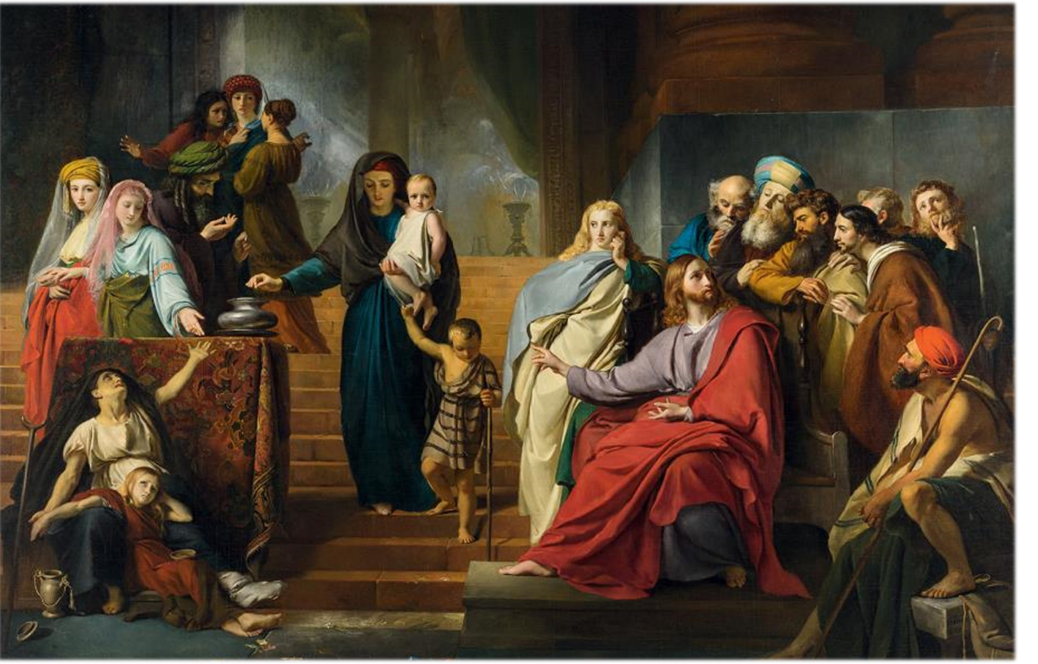
<가난한 과부의 헌금> 프랑수아 조제프 나베, 캔버스에 유채, 1840년. 개인 소장.