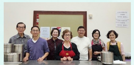
던우디 구역 점심 판매