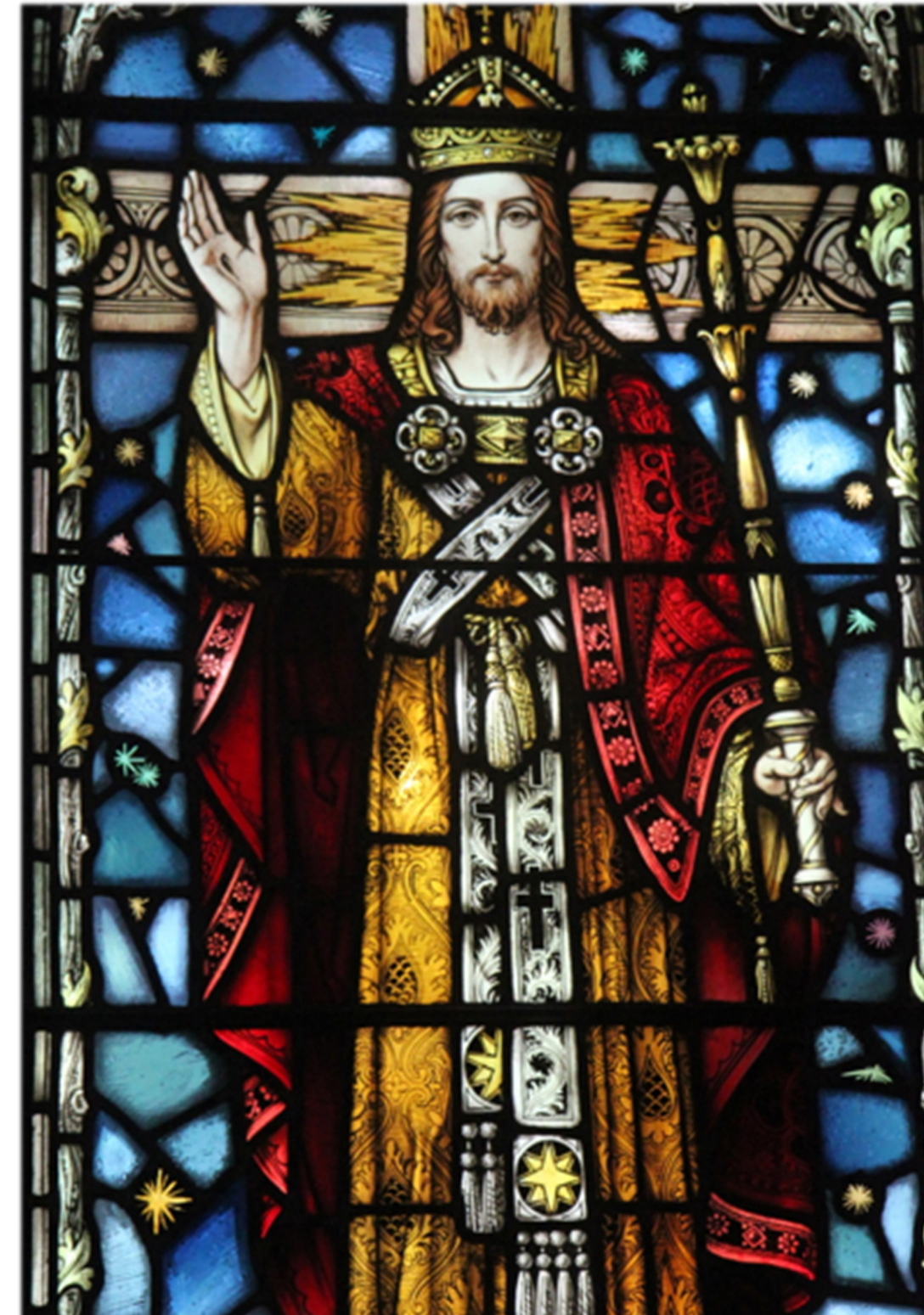
<그리스도왕> Holy Redeemer 성당 유리화. Bar Harbor, ME.