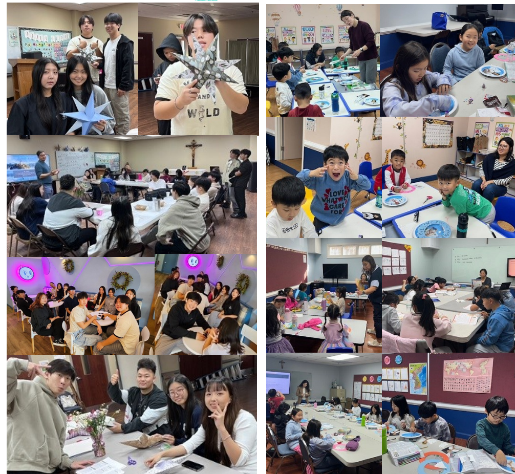
고등부 수업 & 버블티 소셜