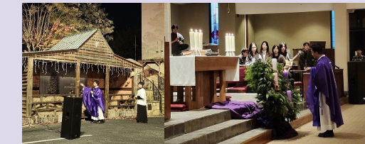
대림의 밤 & 야외 구유 축복식