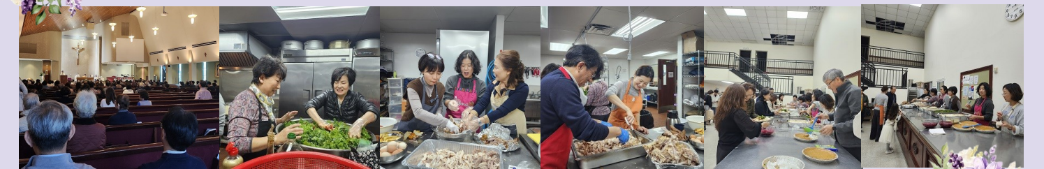
추수 감사절 미사 & 미사 후 사목회 점심 봉사