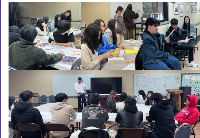
고등부 수업 & 판공성사