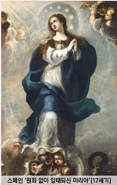
스페인 '원죄 없이 잉태되신 마리아' (17세기)

17~18세기 13명의 교황들은 성모 축일을 장려하면서도 원죄 없는 잉태를 교의로 선포하지는 않았다. 1840년에는 10명의 프랑스 대주교들이 그레고리오 16세 교황에게 공동 서한을 보내 마리아의 원죄 없는 잉태를 교의로 선포할 것을 요청했다. 도미니코회 회원들도 이를 위해 다양한 노력을 기울였다.