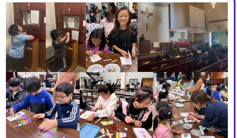
초등부 수업 & 판공성사