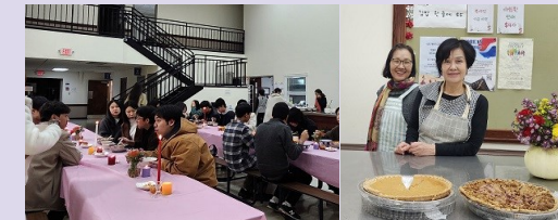
청년미사 후 저녁식사 봉사