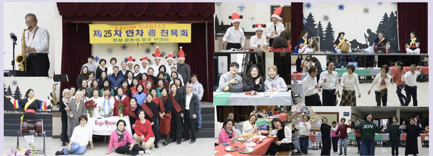
레지오 제 25차 연차 총 친목회