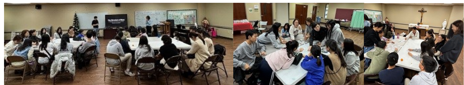
영어 전례팀 교육 & 종강 파티