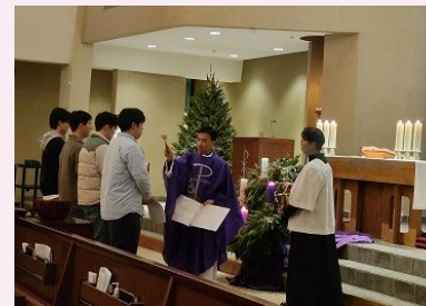
예비 신자 입교 예식