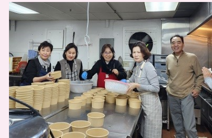
제대회 점심 봉사