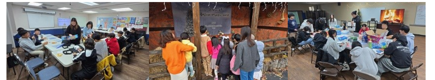
주일학교 수업 - 초등부(야외수업), 중고등부(자선주일 구디백 만들기)