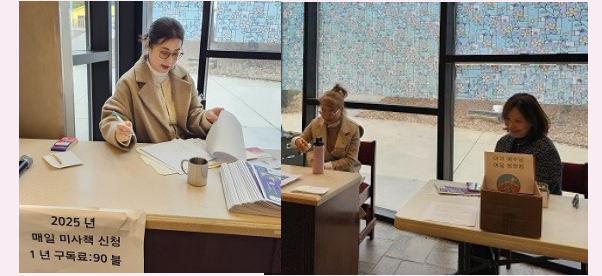
주보 배부 봉사 및 매일미사책 접수