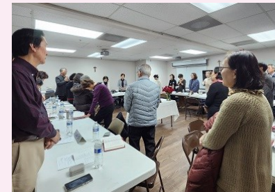
꾸리아 월례 회의