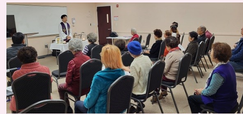
청솔 시니어 센터 미사