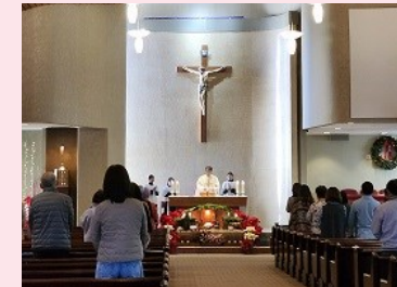
12월 31일 송년 미사