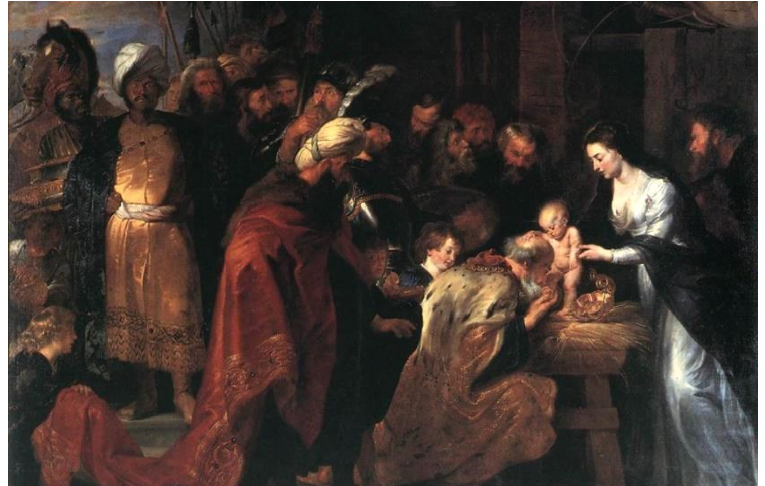
〈동방 박사의 경배〉 피터 폴 루벤스, 캔버스에 유화