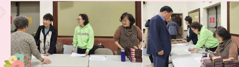
사회복지 분과 시니어 연말 선물 나눔