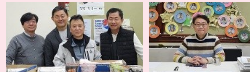
망치회 김밥 판매