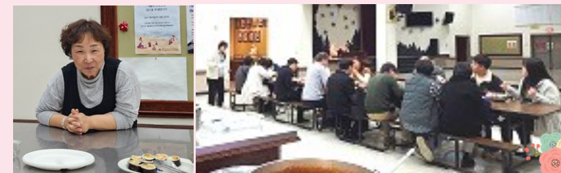
청년 미사 후 저녁 봉사