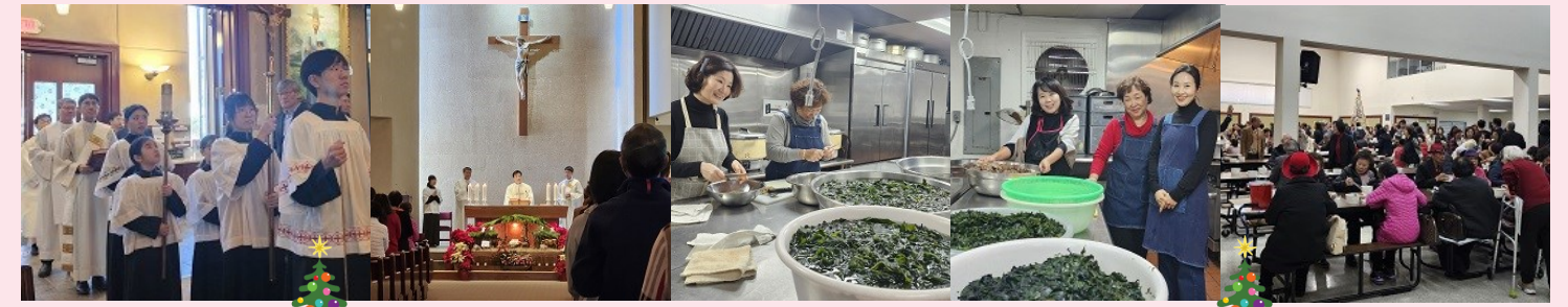
주님 성탄 대축일 낮 미사, 미사 후 성모회 전신자 점심 봉사