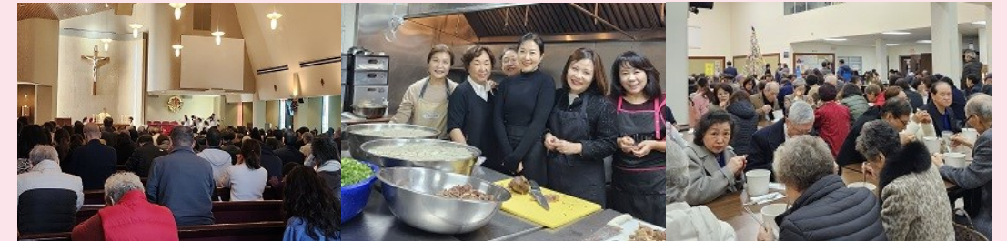
1월 1일 천주의 성모 마리아 대축일 미사 미사 후 성모회 떡국 점심 봉사