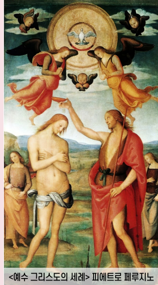
<예수 그리스도의 세례> 피에트로 페루치노

“이는 내가 사랑하는 아들, 내 마음에 드는 아들이다”라는 하늘의 음성은 결국 우리를 위해 돌아가실 의지를 드러낸 예수님의 표징에 대한 하늘의 응답이었다.