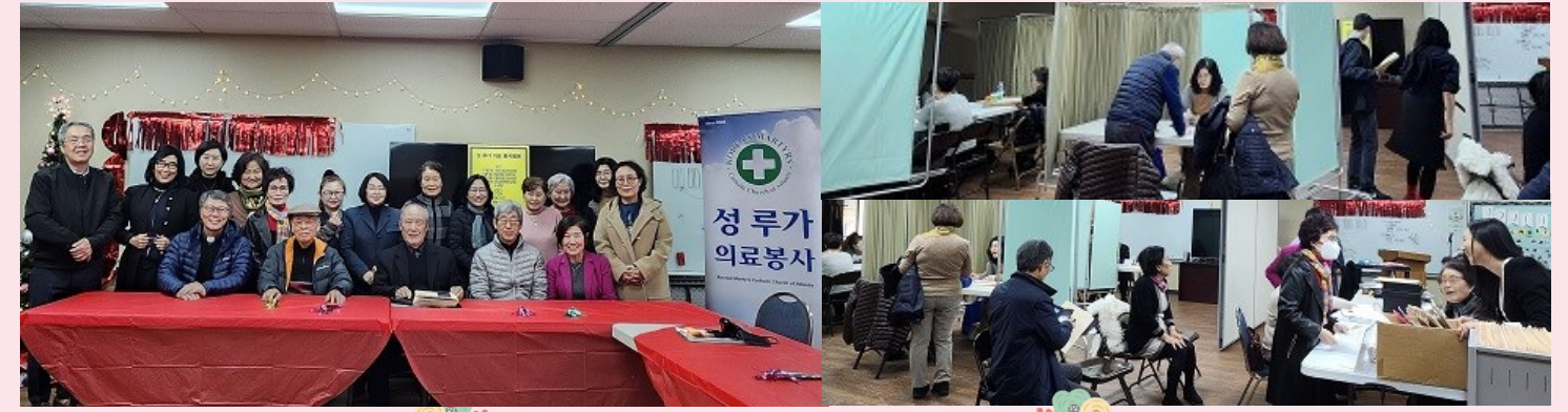
성 루가 의료 봉사회 진료 모습 주교해주신 봉사자분들께 감사드립니다