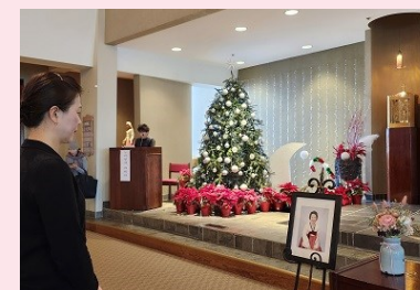
故 이민자 마리아님 연도