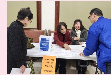
이나시오 영성 침묵 피정 접수