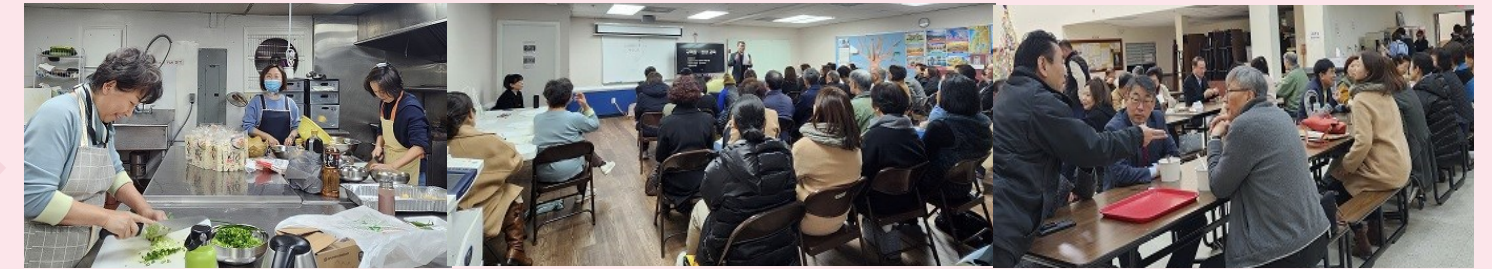
구역장 & 반장 교육 및 점심 식사 봉사