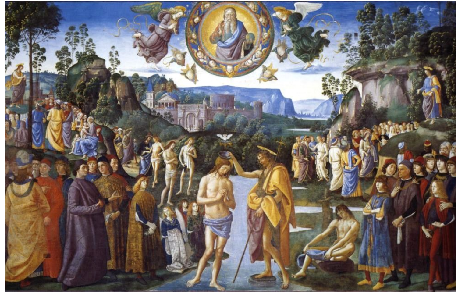
〈세례를 받으시는 예수님〉 페루지노와 페루지노 공방. 프레스코화. 시스티나 경당, 로마