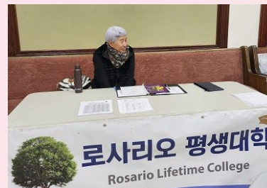
평생대학 신학기 접수