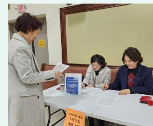
이냐시오 영성 침묵 피정 접수