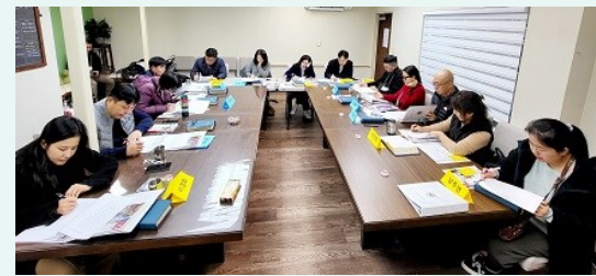
예비자 교리반 수업