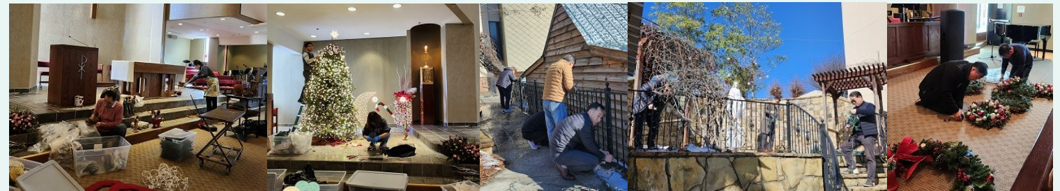
성탄 및 구유 장식 해체 수고해주신 봉사자분들께 감사드립니다