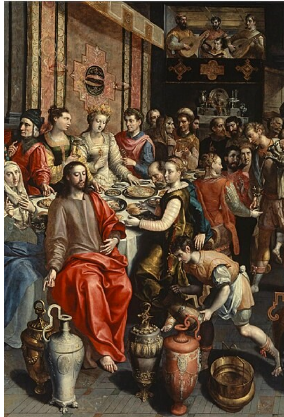
<카나의 혼인잔치> 마르틴 데 보스, 안트워펜 노트르담 대성당, 벨기에