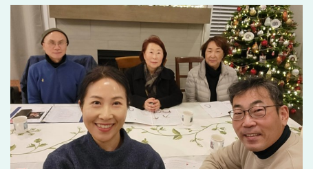
피치 라즈웰 3반 반모임