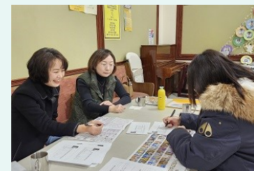
한국 천주교회사 공부반 모집