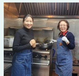
청년 미사 저녁 봉사