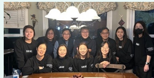
주일학교 교사 워크샵