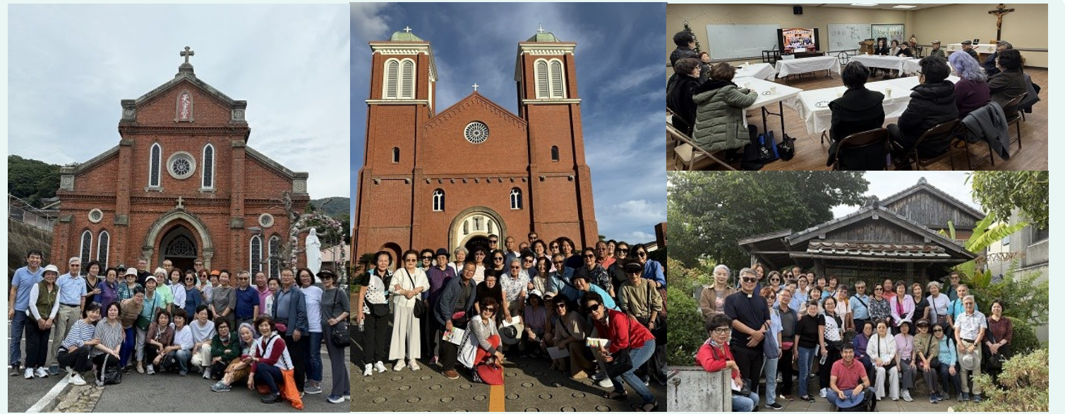
일본 & 한국 성지 순례팀 단체사진, 지난 주일 성지 순례 후 모임