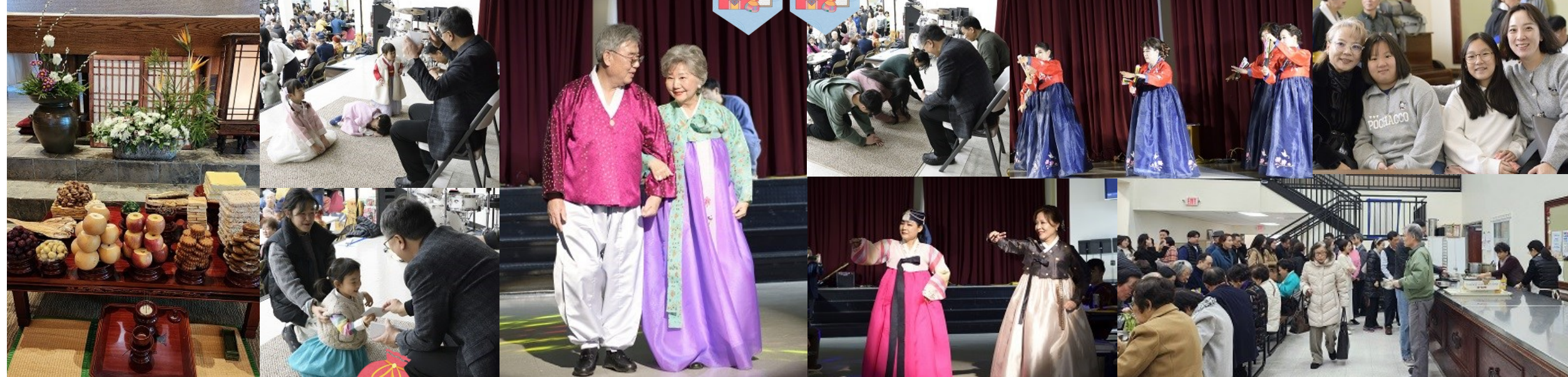
지난 주일 설 미사 후 설날 행사가 있었습니다. 행사에 참여해주신 신자분들, 학생들 모두 감사드립니다.