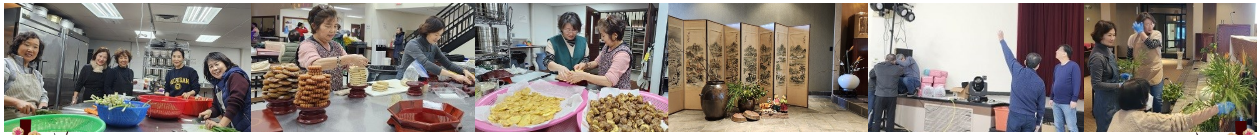
설 미사 제대 준비, 미사 후 떡국 점심 봉사, 설날 행사를 위해 수고해주신 사목회, 성모회, 제대회 및 봉사자님들께 진심으로 감사드립니다.