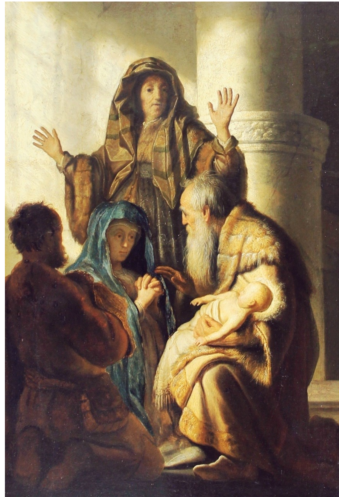
<아기 예수의 성전 봉헌> 렘브란트, 1629년, 패넬에 유채, 56x44cm, 함부르크 미술관, 독일