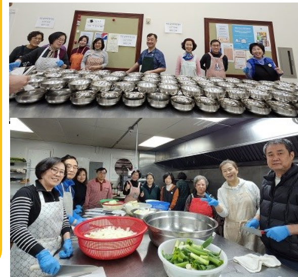
1월 19일 주일 돌루스 구역 점심 봉사