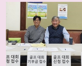
골프 대회 신청 & 기부금 접수