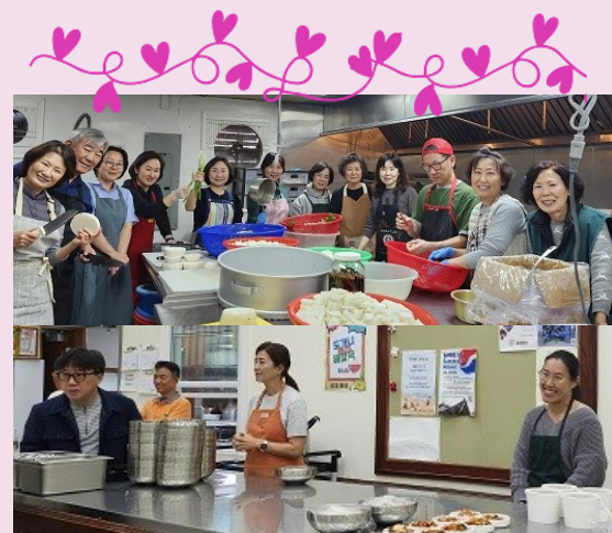
알파레타 구역 점심 봉사