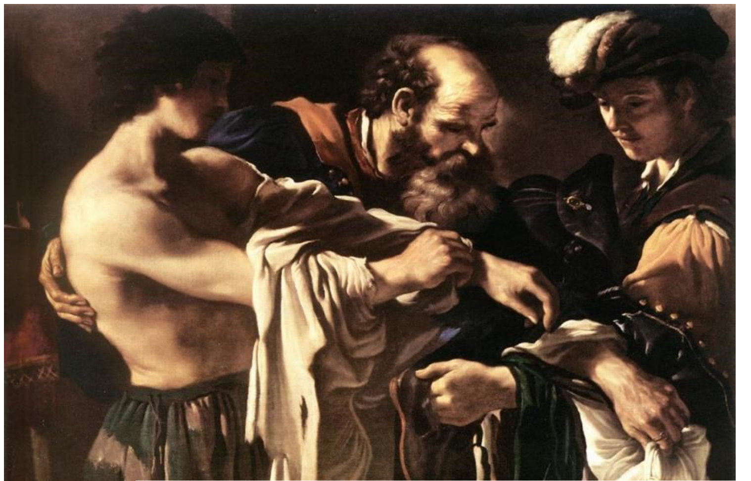
<돌아온 탕자> 구에르치노, 1619, 캔버스에 유채, 106.5x143.5cm, 미술사 박물관, 비엔나, 오스트리아