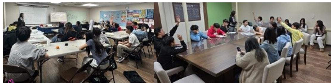
중등부 수업 및 판공성사 준비