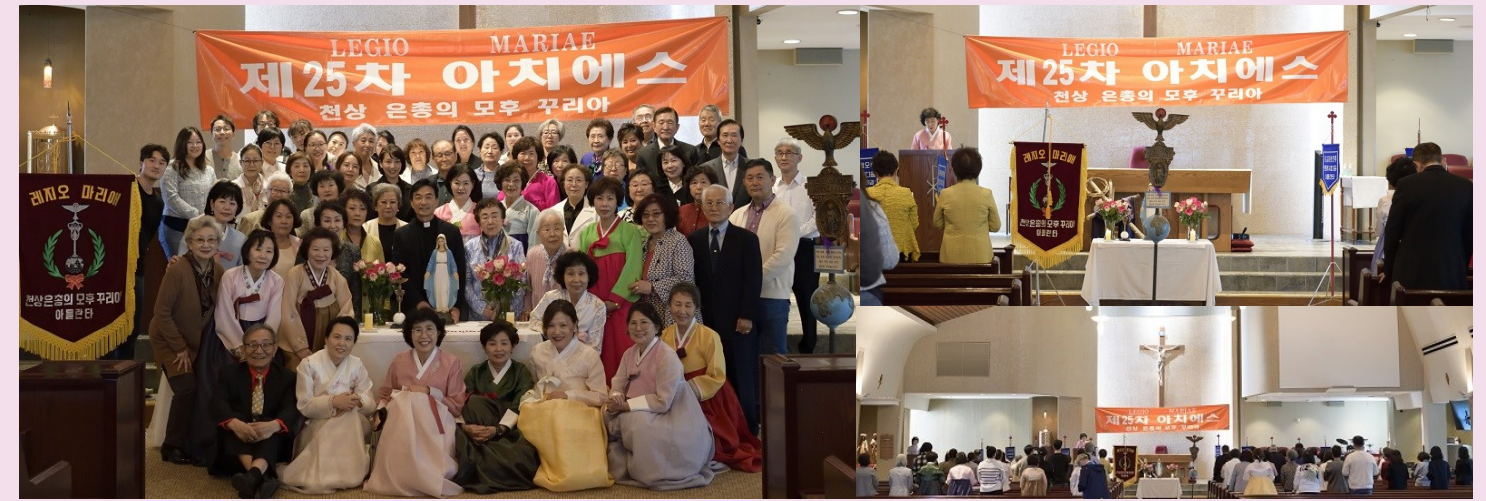
레지오 마리에 아치에스 3월 23일 (일)