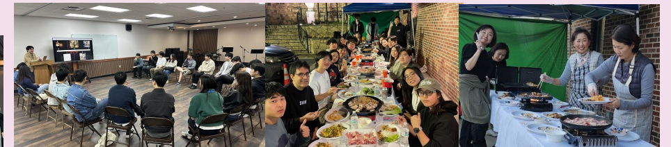
MAGIS 기도 성찰 모임 후 저녁 식사-봉사자님들