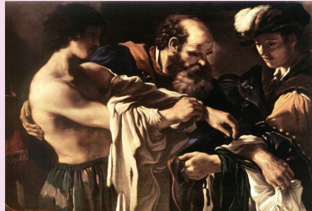
구에르치노, 1619, 캔버스에 유채, 미술사 박물관, 비엔나, 오스트리아

구에르치노(Guercino, 1591-1666)의 본명은 조반니 프란체스코 바르비에리(Giovanni Francesco Barbieri)로 이탈리아의 첸토(Cento)에서 태어났다. '구에르치노'라는 이름은 '사팔뜨기'라는 뜻으로 그가 어렸을 때 사고로 생긴 상처로 인해 붙여진 별명이다. 가난했던 그는 당시의 주요 화파였던 볼로냐파의 작품을 거의 독학으로 익혔으며, 카라바조의 강렬한 빛의 명암대비를 절충하여 화려한 색감에 극적인 빛의 효과와 극적인 감정 표현을 결합시켜 서정적이면서도 힘이 넘치는 바로크 미술을 탄생시켰다.