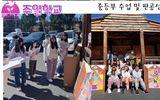
초등부 아이들이 함께 만든 십자가의 길 14처에서 3-5학년 아이들이 기도하는 모습.